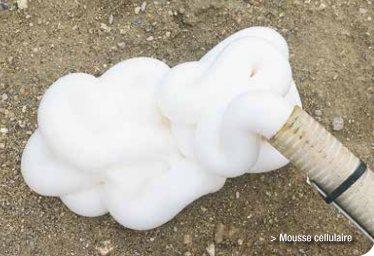
> Mousse cellulaire