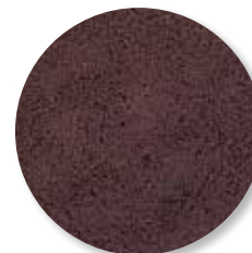
> Béton courant