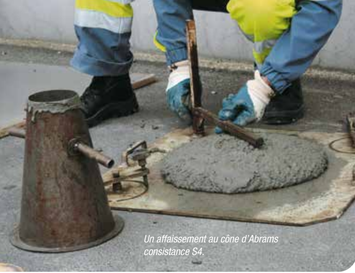
Un affaissement au cône d'Abrams consistance S4.